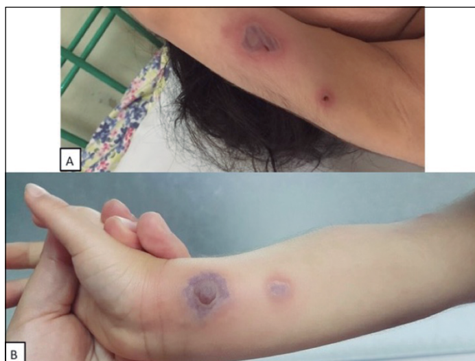
Figura 2. Imagen clínica. Ampollas en extremidad superior derecha A: Ampolla de contenido hemorrágico, base eritematosa de 2 cm diámetro en cara interna de brazo derecho. B: Ampolla tensa de contenido hemorrágico, violácea de 2,5 cm diámetro en antebrazo derecho.