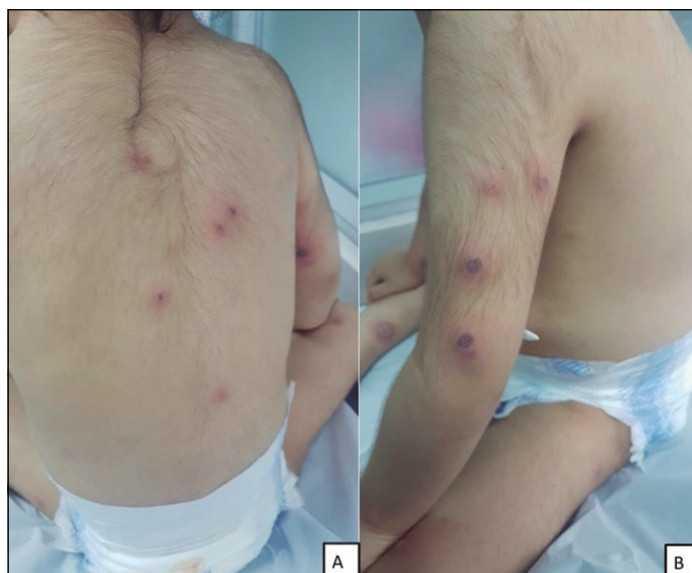
Figura 1. Imagen clínica. A: Ampollas y úlceras costrosas en región dorsolumbar. B: Ampollas y úlceras costrosas en brazo izquierdo.

El SS en pediatría es una condición muy infrecuente. Se ha descrito una distribución equitativa por género, pero con un leve predominio en el género masculino en los menores de 3 años (6) . La edad promedio de diagnóstico en los casos pediátricos corresponde a 5 años (6) . Las lesiones cutáneas son típicamente sensibles y se presentan como nódulos o pápulas rojas o violáceas, pudiendo desarrollar lesiones tipo placas y en ocasiones lesiones ampollares. Normalmente se distribuyen de forma asimétrica y curan sin dejar ci-