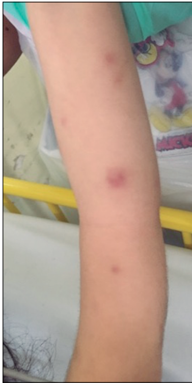
Figura 3. Imagen clínica. Pápulas y nodulos eritematosos en brazo y antebrazo izquierdo.

catriz. Pueden ser precedidas por varios días a semanas de fiebre (7) . Los síntomas y/o signos comúnmente asociados corresponden a artritis, mialgias y compromiso del estado general (3) . Los hallazgos de laboratorio más frecuentes corresponden a neutrofilia y VHS elevada, por lo que muchas veces el diagnóstico se ve retrasado, al confundirse con un cuadro infeccioso (7,8) . Dentro de los criterios diagnósticos propuestos, en la histopatología destaca la presencia de infiltrado neutrofilico en la dermis, sin vasculitis leucocitaria clásica (5) . Este infiltrado se extiende a menudo a lo largo de toda la